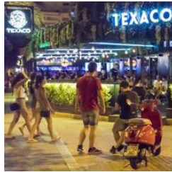
Zona de ocio de Alicante, esta semana, repleta de jóvenes

Montoro ahonda en esa reflexión: « Los varones tienen cuatro veces más de posibilidad de morir por estas circunstancias ». Ellas suelen ser más prudentes. El profesor aconseja: «Los pasajeros tienen que ser absolutamente radicales en impedir que una persona que ha consumido conduzca». El objetivo no es otro que «defender su propia vida». La conclusión, pesimista, es que la estampa se repite por todo el país. Sin distinción. Les invitamos a este paseo en coche con los redactores de ABC: