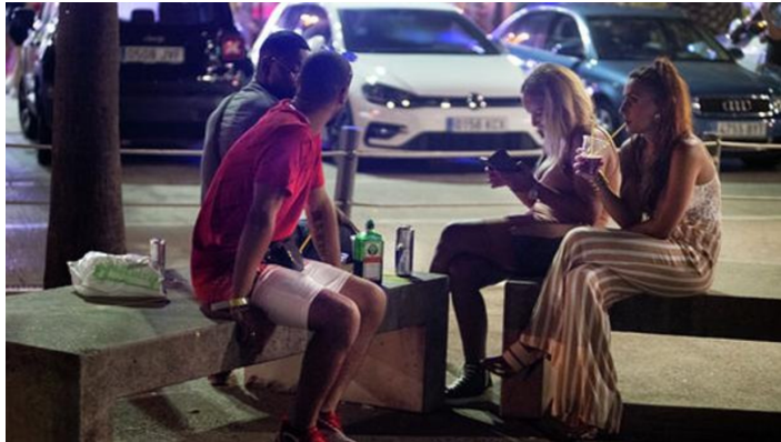
Un grupo de jóvenes disfrutan de su tiempo de ocio, una noche de esta semana, en Barcelona